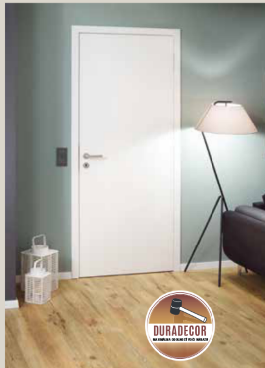
Obrazok: Interiérové dvere s bezfalcovým krídlom dverí, skryto umiestnenými závesmi a s povrchom Duradecor vo farbe RAL 9016 biely lak